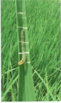
চিত্র ১: পোকার কীড়া

রোপা আমন মৌসুমে বাংলাদেশ ধান গবেষণা ইনস্টিটিউট এর গবেষণা খামারে ধানের জমিতে পাতা মোড়ানো পোকার আক্রমণ লক্ষ্য করা যাচ্ছে। ডিম থেকে ফোটার পর কীড়াগুলো গাছের মাঝখানের দিকের পাতার একেবারে মাথায় দু-একদিন কুরে কুরে খায় (চিত্র-১)। তারপর আস্তে আস্তে মুখের লালা দিয়ে পাতাকে লম্বালম্বিভাবে মুড়িয়ে নলাকার করে ফেলে এবং মোড়ানো পাতার মধ্যে থেকে পাতার সবুজ অংশ কুরে কুরে খেয়ে ফেলে। এ পোকার ক্ষতিগ্রস্থ পাতায় প্রথমদিকে সাদা লম্বা খাওয়ার দাগ দেখা যায় (চিত্র-২)। খুব বেশী ক্ষতি করলে পাতাগুলো পুড়ে যাওয়ার মত দেখায়।