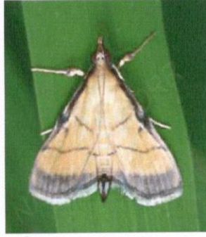
চিত্র ২: পাতা মোড়ানো পোকা