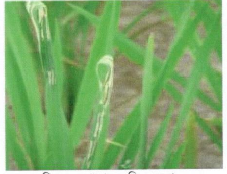
চিত্র ৩: পোকার ক্ষতির নমুনা