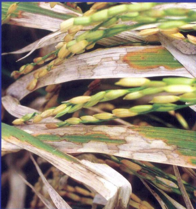
চিত্র-২: পাতায় খোলপোড়া রোগের লক্ষণ