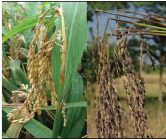
নেক ব্লাস্ট রোগের লক্ষণ