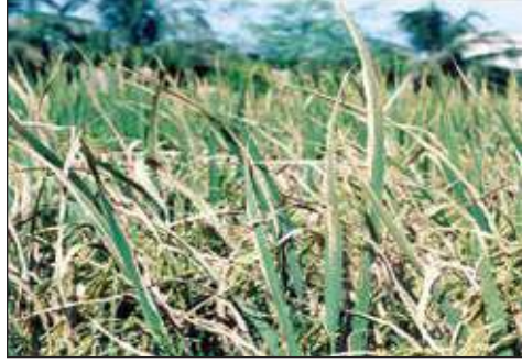
পাতাপোড়া রোগের লক্ষণ