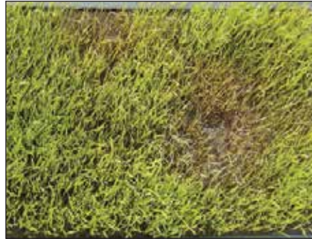
চারাপোড়া রোগের লক্ষণ