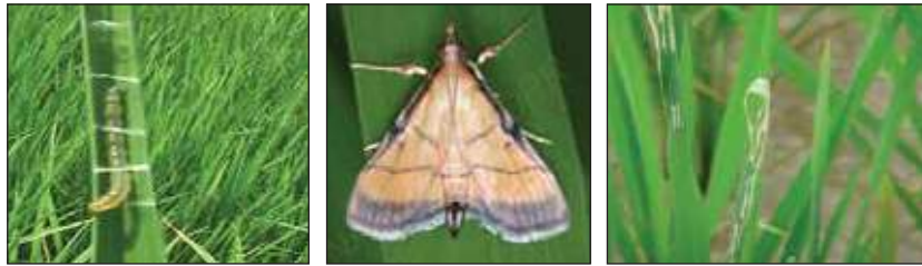
পাতামোড়ানো পোকাকার কীড়া