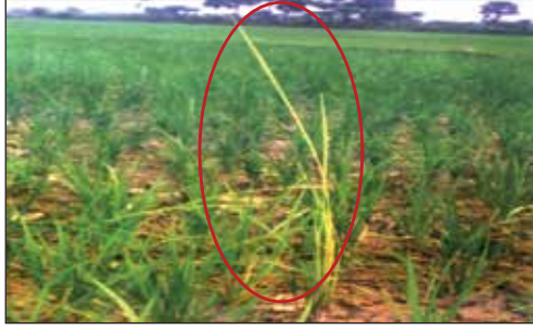
বাকানি রোগের লক্ষণ