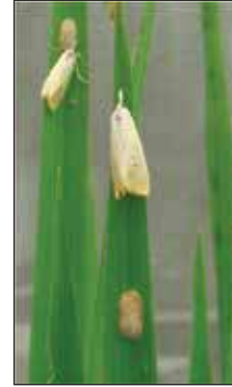
পূর্ণবয়স্ক মাজরা পোকা