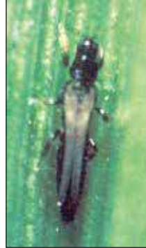
পূর্ণ বয়স্ক থ্রিপস