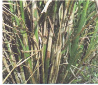
চিত্র. খোলপোড়া রোগের লক্ষণ