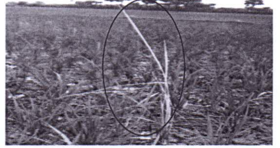
চিত্রঃ বাকানী আক্রান্ত ধানের জমি

এই গাছগুলো লিকলিকে হয় এবং ফ্যাকাশে সবুজ রঙ ধারণ করে। আক্রান্ত গাছ বেঁচে থাকলেও শেষ পর্যন্ত ছড়ায় ধান চিটা হয়ে যায়। কান্ডের গোড়ায় ১ম, ২য় ও ৩য় গিট বা পর্ব সন্ধিতে অস্থানীক শিকড় গজায়।