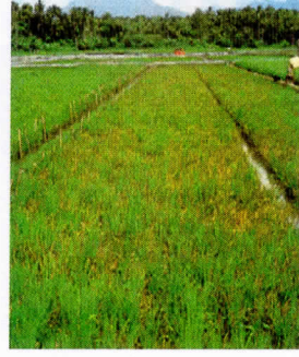
চিত্র ২ : টুংরো আক্রান্ত জমি

এ পোকা এবং টুংরো থেকে ধান ফসল রক্ষার জন্য-