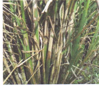
চিত্র. খোলপোড়া রোগের লক্ষণ